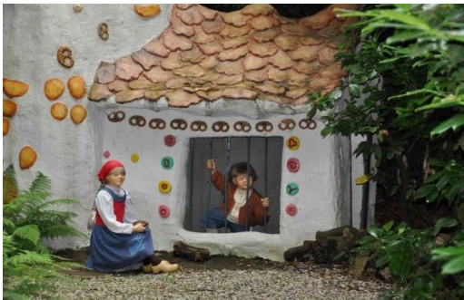
hans en grietje