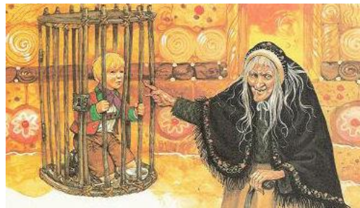
de boze heks