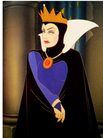
de boze koningin