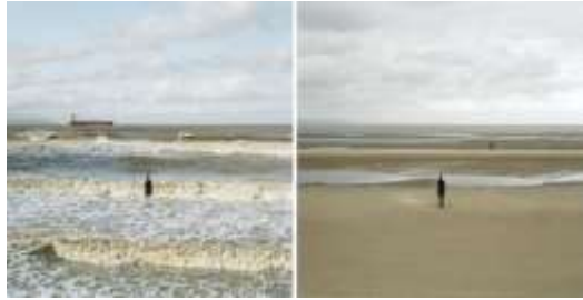
vloed en eb