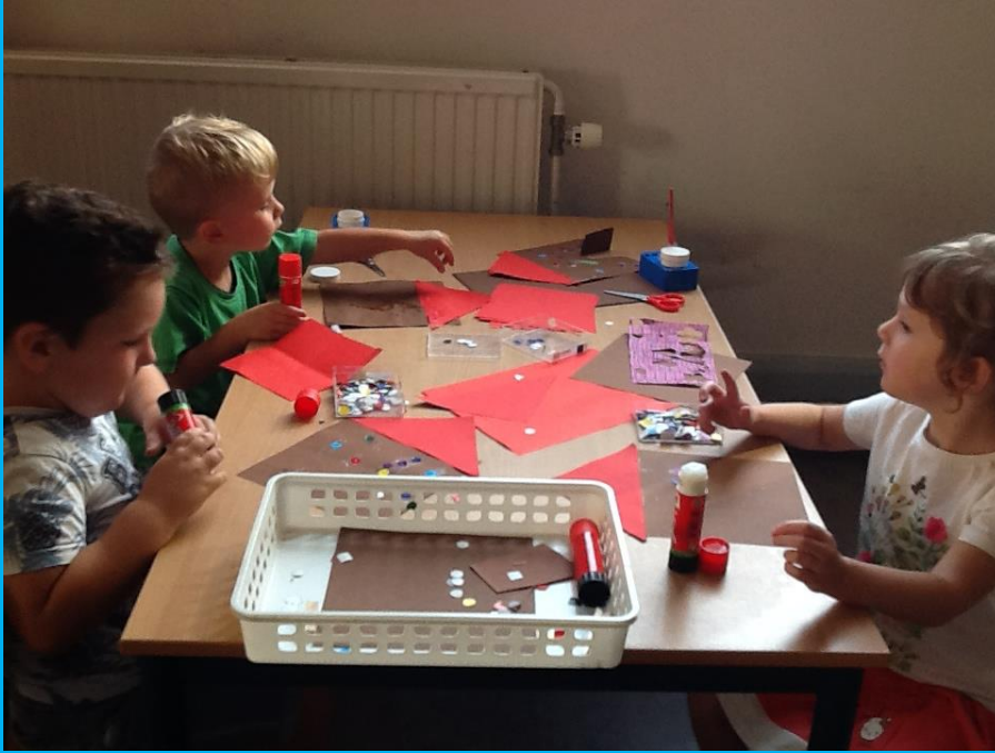
We knutselen het snoephuisje van de heks van Hans en Grietje.