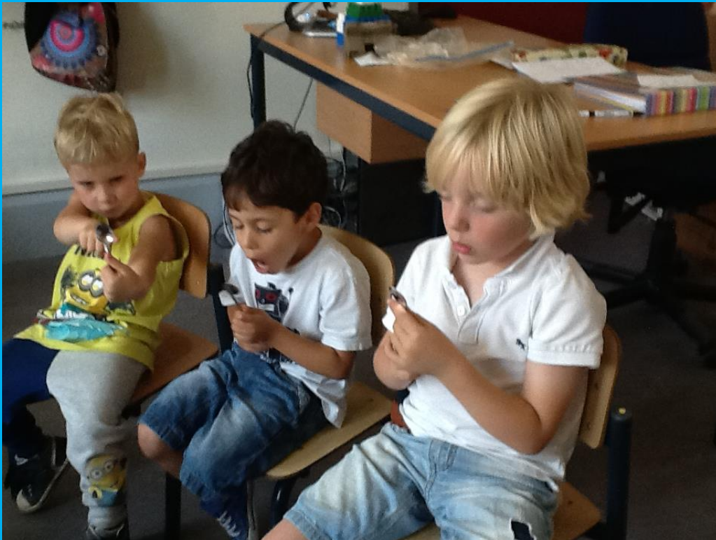
In de kring doet we proefjes met lepels, wonderlijk!