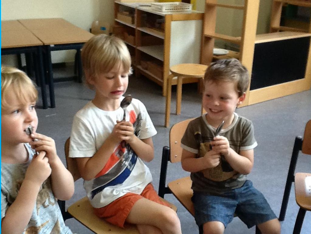
Spiegeltje spiegeltje aan de wand, wat is er met deze spiegels aan de hand?